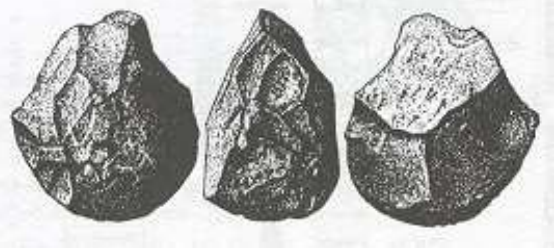
Galet taillé découvert sur le site de Kada Gona (Ethiopie) daté de 2,6 millions d'années (Histoire d'ancêtres – Editions Artcom')